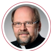
Weihbischof Wolfgang Bischof