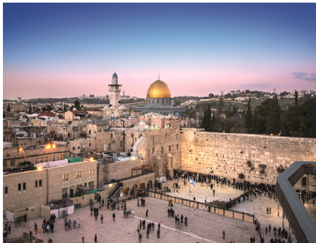
Klagemauer und Felsendom